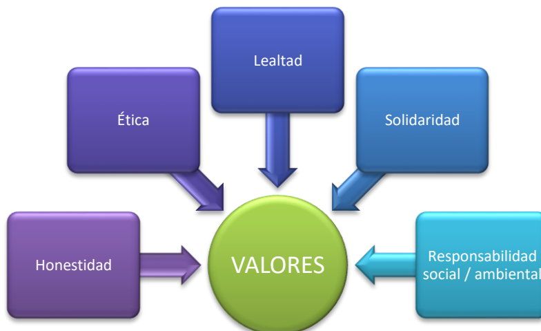
Ilustración 2 Valores C.I.C.P.

La naturaleza del Colegio de Ingenieros Civiles de Pichincha le impulsa a actuar con estricto apego a la Constitución y leyes, bajo los siguientes valores: