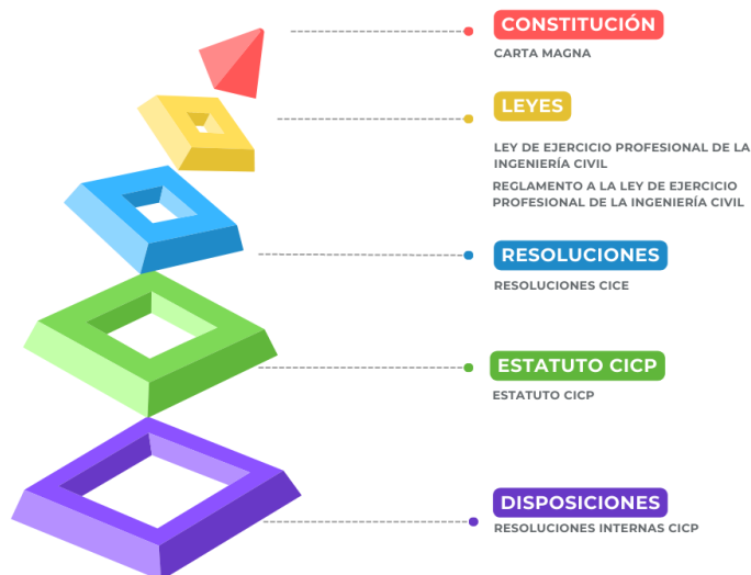
Ilustración 1 Pirámide de Kelsen - Marco legal que rige al CICE

A continuación se muestra la pirámide de Kelsen adaptada al marco legal correspondiente a la gestión del C.I.C.P.: