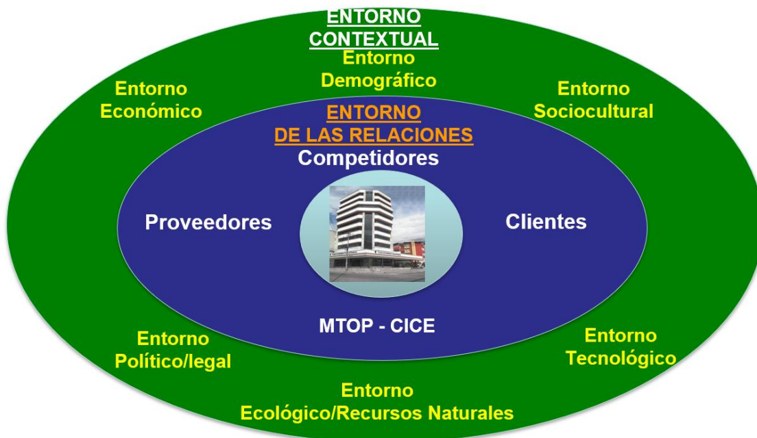
Ilustración 3 Mapa de actores C.I.C.P.

El diagrama que se muestra a continuación representa al C.I.C.P., visto como un sistema y permite identificar su entorno externo e interno: